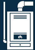
APPAREIL DE CHAUFFAGE